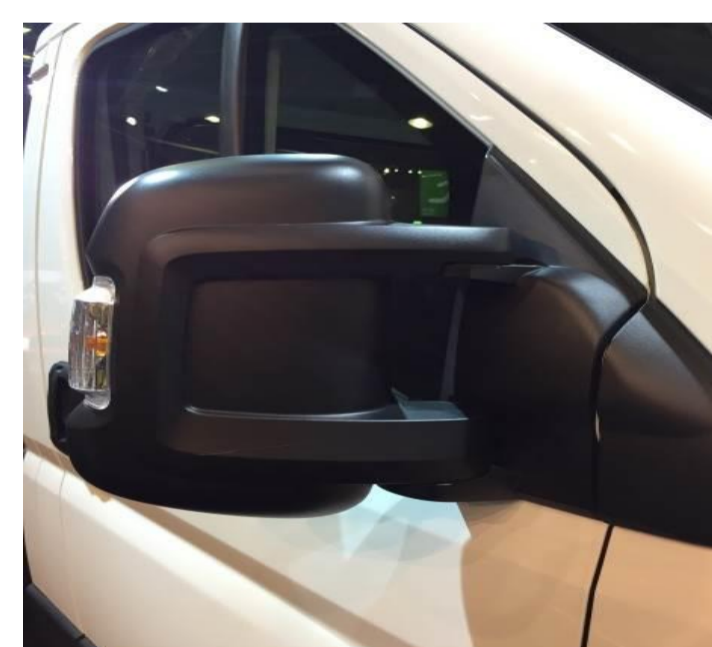
↑ стандартні зовнішні дзеркала.