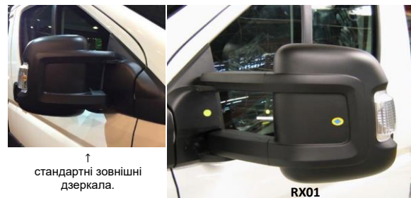
↑ стандартні зовнішні дзеркала.